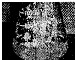
图 3 培养基 WL 6 中根的生长情况