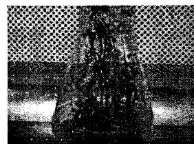
图 4 培养基 WL 4 中生长的组培苗