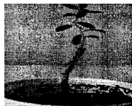
图 1 银柳胡颓子的移栽苗