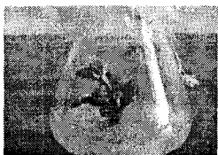
图 4 在 10 号培养基上生长的不定芽

试验中愈伤组织均为绿色,由花瓣基部细胞分化产生,而花瓣其它部位不变绿,不分化。其可能原因是花