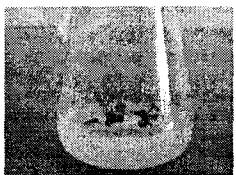
图 3 在 17 号培养基上生长的不定芽